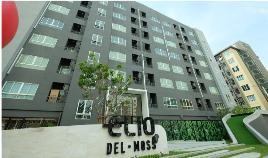
ทิศเหนือ ติดกับคอนโด เอลิโอ เดล มอสส์ พหลโยธิน