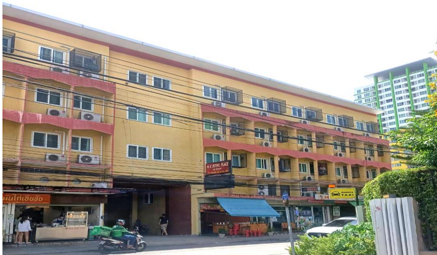
ทิศตะวันตก ติดกับ เอ็ม.เค.รอยัลเพลส แอท เกษตร