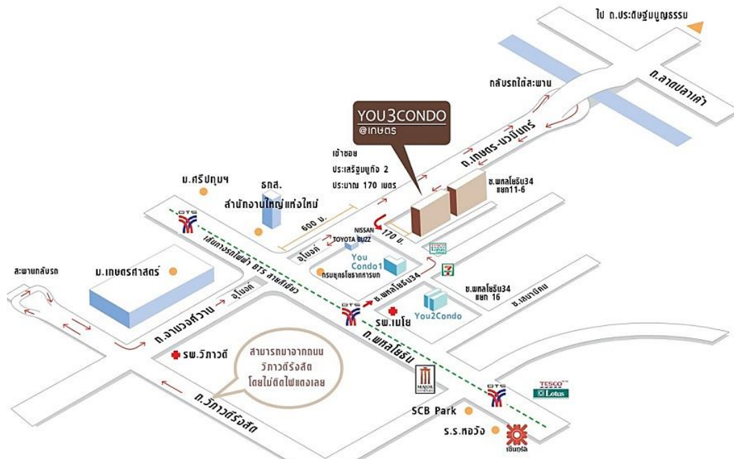
รูปภาพสถานที่ตั้งโครงการ