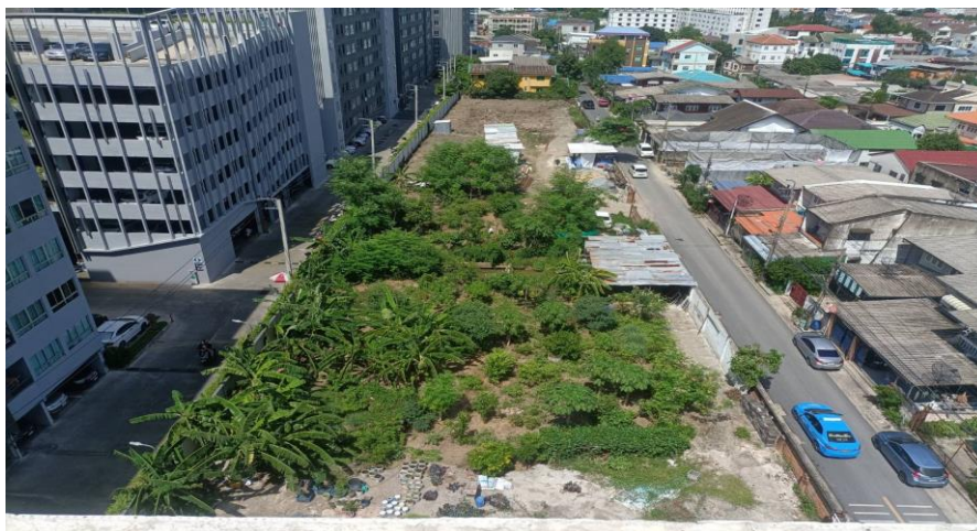
ทิศตะวันออก ติดกับพื้นที่ว่าง