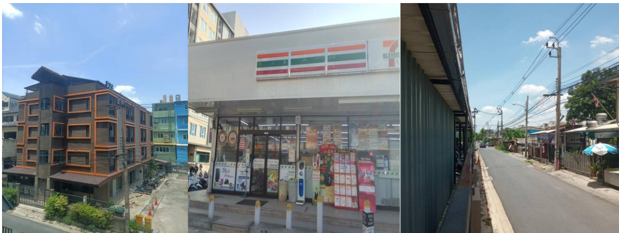
ทิศใต้ ติดกับ P29 Mansion 7-ELEVEN และบ้านพักอาศัย